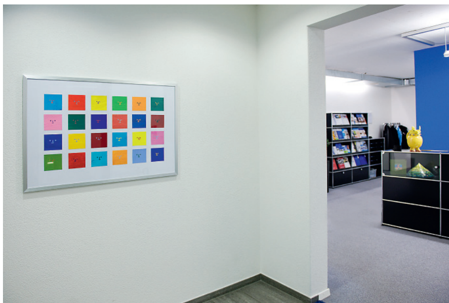
«Menschen»: Die Bild-Collage von Manuel Brunner wird unter unseren interessierten Kunden und Partnern verlost.

Unsere Firma kauft dieses Werk (Collage und Gouache, 70x100) von Manuel Brunner und verlost es unter unseren Kunden und Partnern. Die Verlosungskarte liegt diesem Bulletin bei. Wenn Sie an der Verlosung teilnehmen möchten, senden Sie uns die Karte bitte retour. Mit dieser Aktion möchten wir den Menschen der Institution Brändi unsere Wertschätzung entgegen bringen.