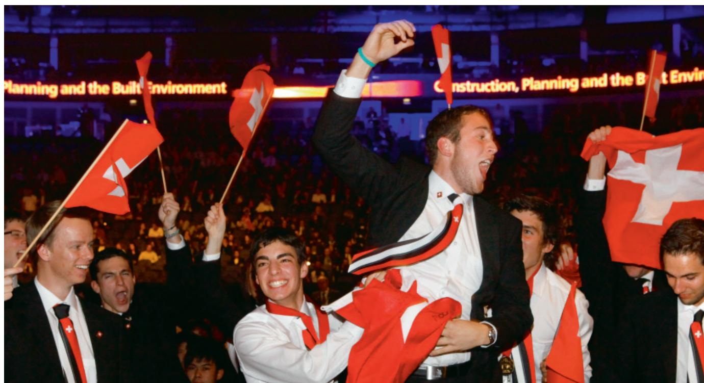
WorldSkills London 2011: Die Schweizer Delegation hatte allen Grund zum Jubeln.

Mehr über WorldSkills London und über SwissSkills unter: www.swiss-skills.ch